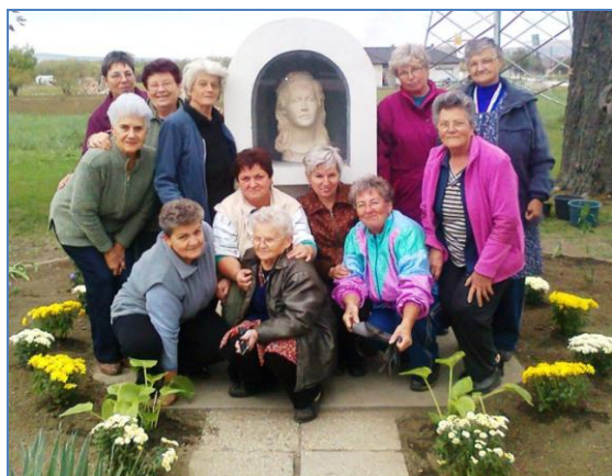
Ismét egy szép példája az összefogásnak

Évtizedek óta komoly gondot jelent a településünket Várpalotával összekötő közút leromlott, balesetveszélyes állapota. Számptalan levélváltás és személyes megbeszélés eredményeként, szeptember hónapban a legkritikusabb úthibák javításra kerültek.