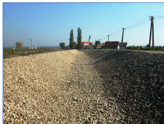
Elkészült a Sárvíz-malomcsatorna kőmedre

A munkálatok utolsó elemeként elkészült a csatornák vízszintjének szabályozását lehetővé tevő zsiliprendszer is.