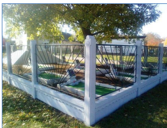
Megújult a II. világháborús sírkert

Minisztériumi költségvetésből megújult a II. világháborúban, községünkben elhunyt orosz katonák sírkertje. Az Oroszország és Magyarország között fennálló egyezmény értelmében a két nemzet kölcsönösen tiszteletben tartja egymás katonai síremlékeit és temetőit, valamint gondoskodik azok felújításáról, gondozásáról.